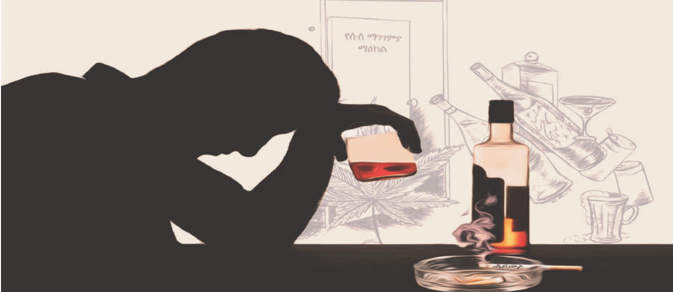
ሥዕል 6: በሱስ የተያዘ ሰው

እዚህ በማስከተል ሱስኝነትን ሰማከም የሚያስችሉ ስልቶችን እንመሰክታለን።