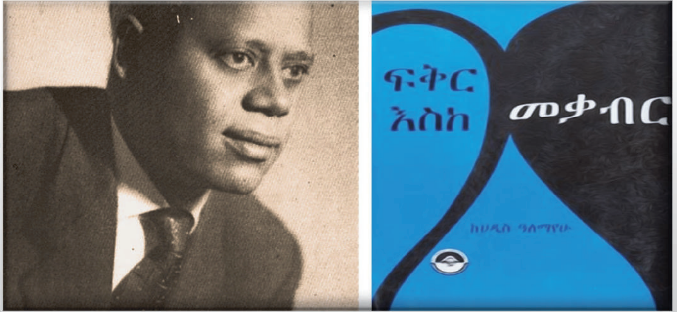
ሥልጠና 3፡ ህዳሴ ዓለማዊና መጽሐፍቶች