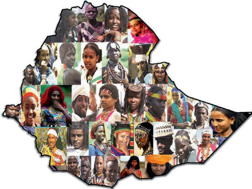
ሥዕል 10: የተወሰኑ የብሔር ብሔረሰብ ምሥሎች

ሌጣ ትርጉሙ ብዝሃነት፣ ዝንቅነት፣ ጉራማይሌነት ወይም ሽርንጉርጉርነት ማለት ነው። አንድነት ማለት ደግሞ ኅብራዊነት፣ ተመሳሳሪ ወይም ወጥነት ነው። ብዝሃነትና አንድነት የተፈጥሮ ቀለማት ናቸው። ተፈጥሮ ህልቆ መሳፍርቷን የምታቻችልበት፣ ጎደሎዋን የምትሞላበት፣ ህልውናዋን የምታረጋግጥባቸው መንገዶች ናቸው። ልዩነት እንጂ ተቃርኖ የላቸውም። አይነጣጠሉም፣ አንዱ ያለሌላው አይኖርም። በሽርንጉርጉርነት ውስጥ ኅብር፣ በኅብር ውስጥ ሽርንጉርጉርነት አለ። ማኅበራሰብ የተፈጥሮ አካልና አምሳል እንደመሆኑ፣ በአመለካከቱና አኗኗሩ የተፈጥሮውን ቅኝትና መንፈስ መከተል ጤናማ ባሕርይው ነው። የሰውልጅ ቁሳዊ፣ ማኅበራዊና ሥነልቦናዊ ዓለሙን በሥርዓትና በመልክ የሚያሰናዳው፣ የሚገነዘበውና የሚተረጎመው አንድነትና ልዩነታቸውን እያነጠረ ነው። ከሁሉም በላይ ብዝሃነትና አንድነት ተደጋጋሪ የአኗኗር ዘይቤዎች፣ አብሮ የመኖር ፍልስፍናዎች ናቸው።