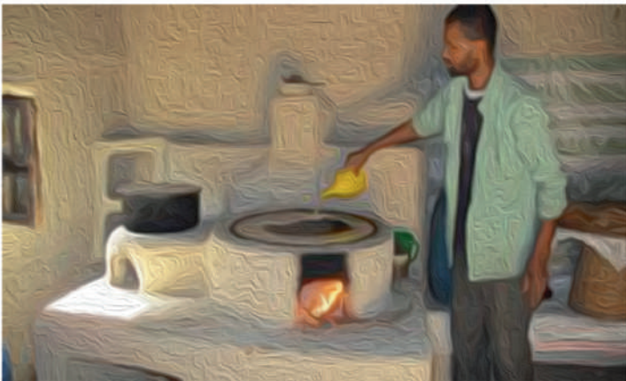
ሥዕል 1: ወንድ እንጅራ ሲገገር

የአውራምባ ማህበረሰብ አባላት የስራ ባህሪ፣ የሚመሩበት የአኗኗር ዘይቤና የሚከተሉት ፍልስፍና ከሌላው ሕብረተሰብ በብዙ መልኩ እንዲለዩ ያደርጋቸዋል። ማህበረሰቡ በአስተሳሰብና በእምነት ፍጹም ለየት ያለ በመሆኑ እምነቱን ፍቅር፣ ሃይማኖቱን ደግሞ ሥራ ያደረገ መሆኑ ብቻ ሳይሆን ይህ ሥራ የሴት ይህኛው ደግሞ የወንድ የሚባል የሥራ ክፍፍልንም ሆነ ልዩነትን አይቀበልም። ሴቶች በሬዎችን ጠምደው ያርሳሉ፤ ሸማ ይሠራሉ። በአጠቃላይም በተለምዶ የወንድ ሥራ ተብሎ በሚታወቀው ማንኛውም ዓይነት እንቅስቃሴ ውስጥ ሁሉ በእኩል ይሳተፋሉ፤ ወንዶች እንጀራ ይጋግራሉ፤ ወጥ ይሠራሉ፤ ጥጥ ይፈትላሉ ወዘተ. ብቻ ስራን ሳይንቁና ወደ ሌላ ሳይገፉ በኩራት ይሰሩታል እንጂ ሀፍረት ብሎ ነገር አይስተዋልባቸውም አውራምባዎች።