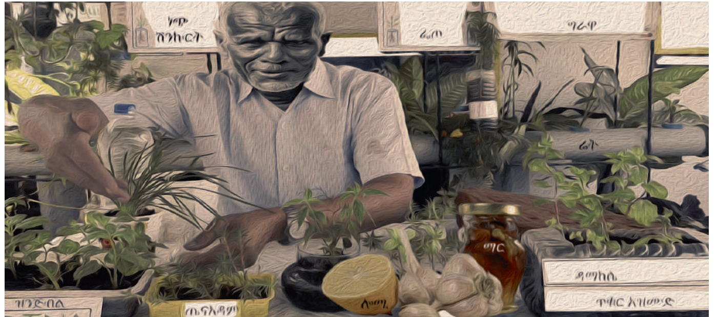
ምዕራ 9፡ ባህላዊ መድኃኒት ስየቀመመ ያስ ሰው

የተለያዩ ዕዎች የዕዎዎት ቀንበጥ፣ ቅጠል፣ ቅርፊት፣ ሥር፣ ግንድ የእንስሳት ተዋዳዎችና የተለያዩ ማዕድናት ለባህላዊ ሕክምና ግብዓት ናቸው። ጤናአዳም፣ ነጭሽንኩር፣ ዝንጅብል፣ ዳማክሴ፣ ኮሶ፣ ሬት፣ ሎሚ የመሳሰሉት አብዛኛው ኢትዮጵያዊ በባህላዊ መንገድ ራሱን ለማከም ከሚጠቀምባቸው መካከል በግንባር ቀደምትነት ይጠቀሳሉ። እርኩስ መንፈስን እንደሚያርቅ ስለሚታመንበት ብዙዎች ጤናአዳምን በየበረንዳቸው ሲተክሉ ይታያል። ጉንፋን የያዘው አንዳንዶችም ወደዘመናዊ ሕክምና መስጫ ከመሄድ ይልቅ በዳማክሴ መታጠብን፣ መጠጣትና መተሻሻት ይመርጣሉ።