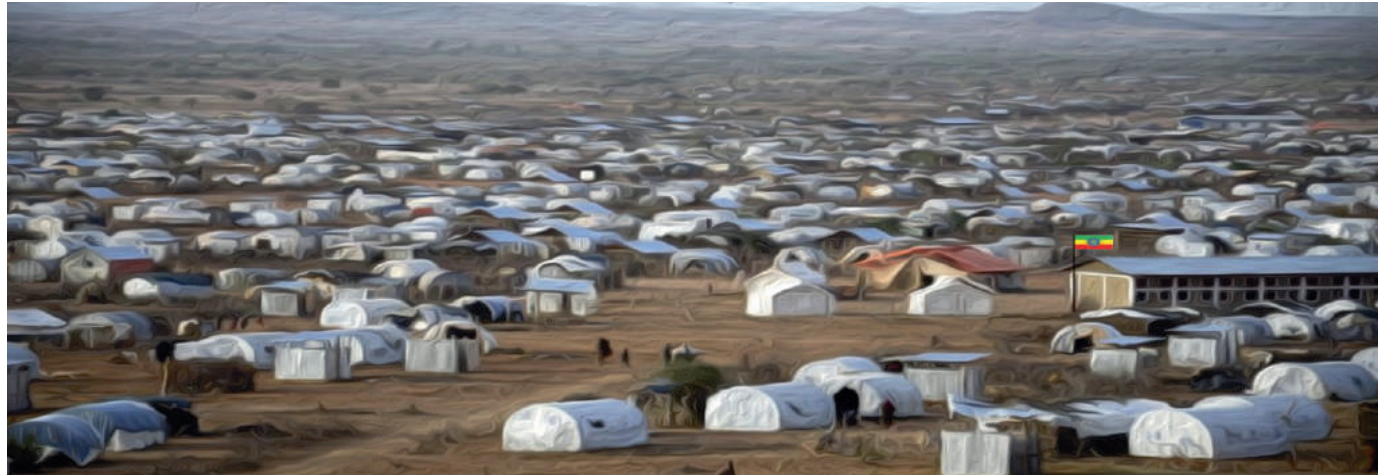
ሥልጠና 8: የስደተኛ መጠበቅ

ኢትዮጵያ አሁንም ስደተኞችን በመቀበል በዓለም አቀፍ ደረጃ ስማቸው ከሚጠራ አስር ሃገራት አንዷ ነች። ከላይ ላይ እንደተጠቀሰው በደቡብ ሱዳን በተቀሰቀሰው የእርስ በርስ ግጭት፣ በሶማሊያ ባለው ሰላም እጦትና ድርቅ ባስከተለው የምግብ እጥረት ሳቢያ ስምንት መቶ ሃምሳ ሺህ ያህል ስደተኞች ወደ ኢትዮጵያ ሸሽተዋል። ኢትዮጵያ እነዚህን ስደተኞች በሃገራቸው እንደሚኖሩ ያህል እንዲሰማቸው በሚያደርግ ሁኔታ ተቀብላ እያስተናገደቻቸው ትገኛለች።