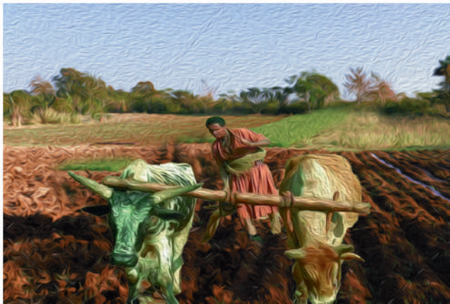
ሥዕል 2: ሴት ስታርስ