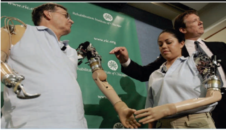
ሥልጠና 4፡ ተፎካዊ ስልጠና ከሰው ሰራሽ ስጅ ጋር መረጃ ሲቀበል