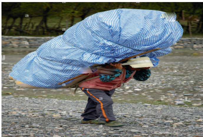
ሦስት 7 : ከባድ ሸክም የተሸከመ ሰው